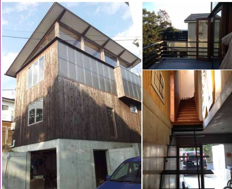
開放的な明るいリビング